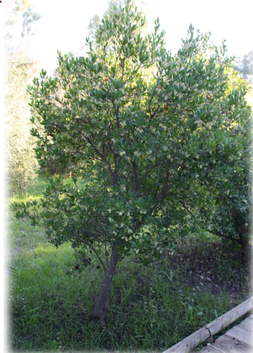
4. Ejemplar de Madroño ( Arbutus unedo ).