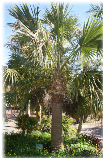
4. Ejemplar de Palma de Sombrero ( Sabal mexicana ).