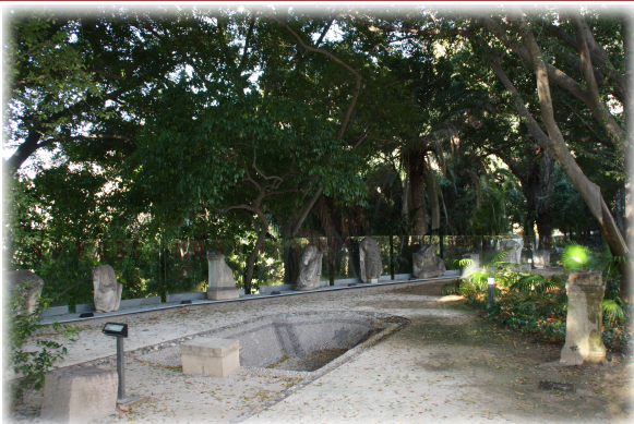
1 y 2. Diferentes imágenes del Jardín. 3. Parte de la colección de restos arqueológicos.