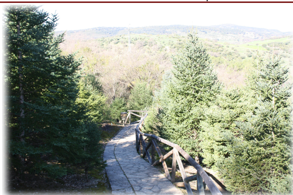
1 y 2. Rincones que nos podemos encontrar en el Jardín. 3. Senda transcurriendo entre Pinsapos.