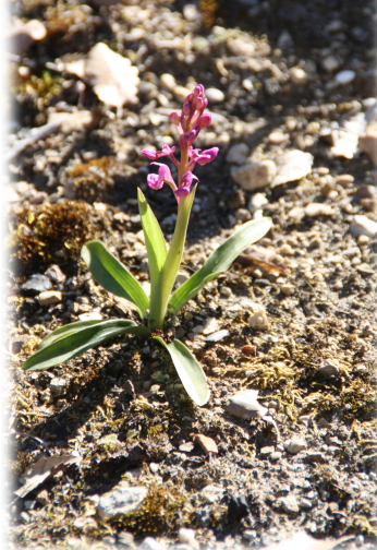
4. Pequeña orquídea en floración de la especie Orchis champagneuxii .