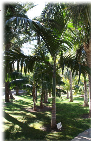
4. Individuo de Camberonia ( Chambeyronia macrocarpa ).