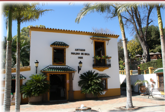
1 y 2. Imágenes generales del Jardín Botánico.