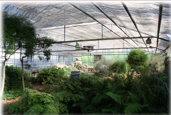
1 y 2. Dos de las zonas que se pueden encontrar en el Jardín. 3. Uno de los invernaderos del Jardín.