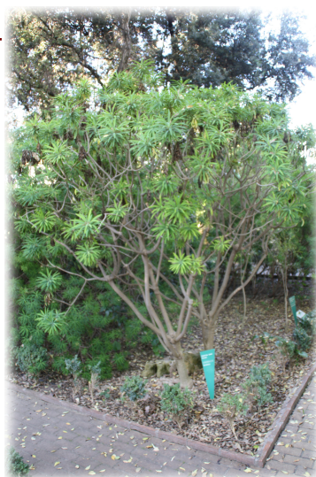
4. Ejemplar de Euphorbia lambii típica de la isla de La Gomera.