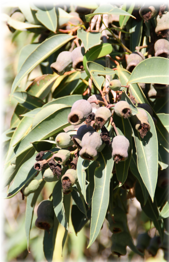
4. Frutos de ( Eucalyptus calophylla ).