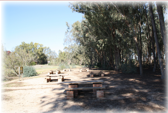
1 y 2. Zonas de Sabinar y de vegetación de Dunas. 3. Zona de pic-nic dentro del Arboreto.