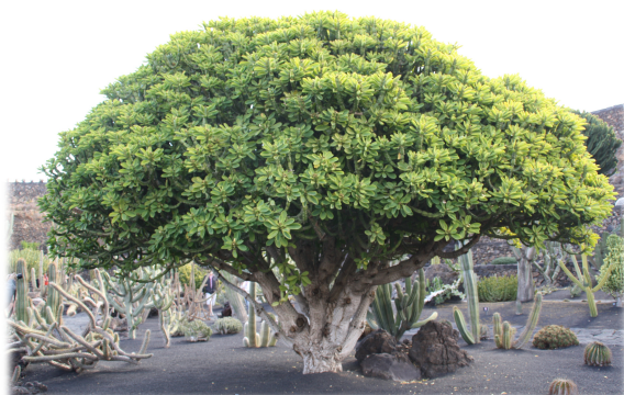
1 y 2. Imágenes generales del Jardín. 3. Ejemplar de Euphorbia neriifolia en el Jardín.