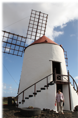
4. Molino visitable dentro de las instalaciones del Jardín.