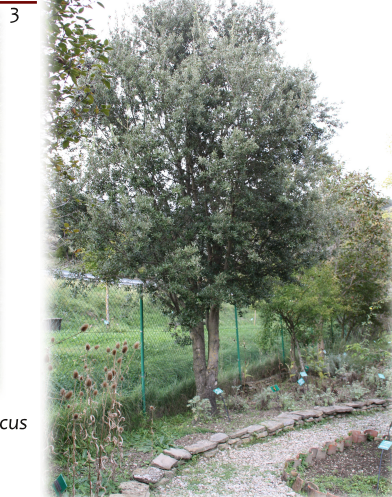
4. Ejemplar de Encina ( Quercus ilex ).