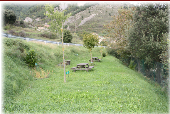
1 y 2. Aspecto del Jardín y sus caminos. 3. Zona de pic-nic anexa al Jardín.