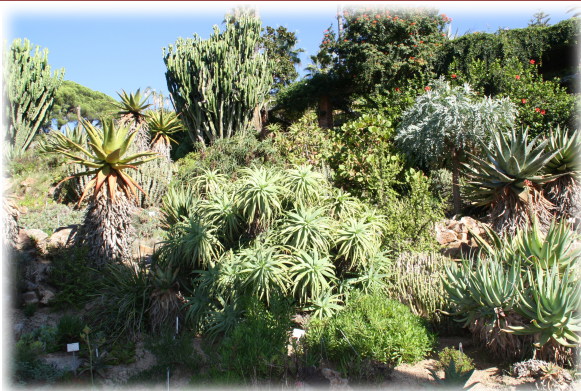
1 y 2. Escenas del Jardín.