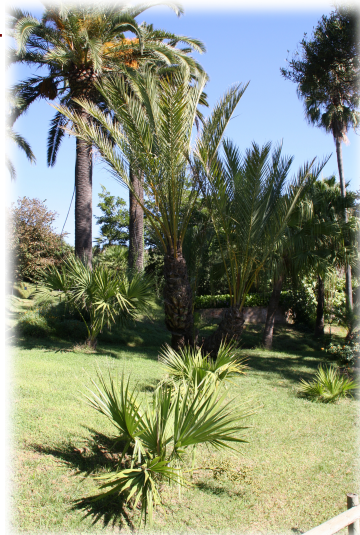
3. Zona dedicada a la vegetación de Jardín. karoo sudafricano.