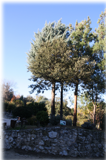
4. Individuos de Encina ( Quercus ilex ).