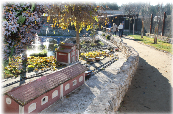
1 y 2. Arco de San Basilio y Castillo de la Mota.