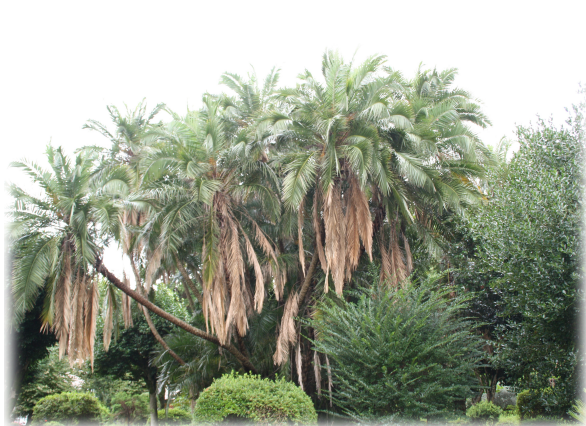
1 y 2. Fotos generales del Jardín.