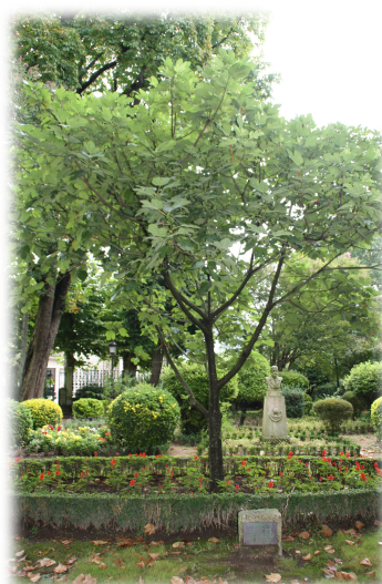
4. Higuera ( Ficus carica ) dedicada a Rosalía de Castro.