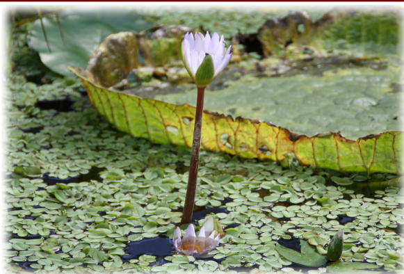
1 y 2. Rincones de aspecto tropical del Jardín.