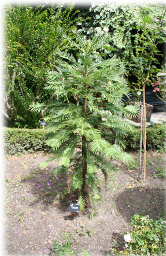
4. Ejemplar de Wollemia nobilis .