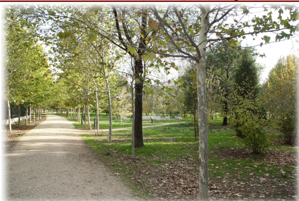
1 y 2. Vistas generales del Arboreto.