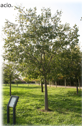
3. Paseo de entrada del Arboreto.