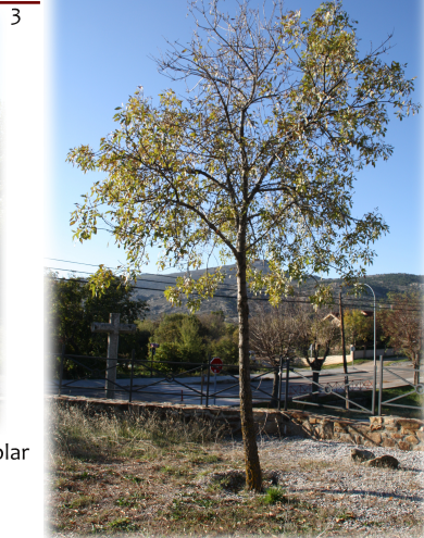
4. Aspecto otoñal del ejemplar de Fresno ( Fraxinus angustifolia ).