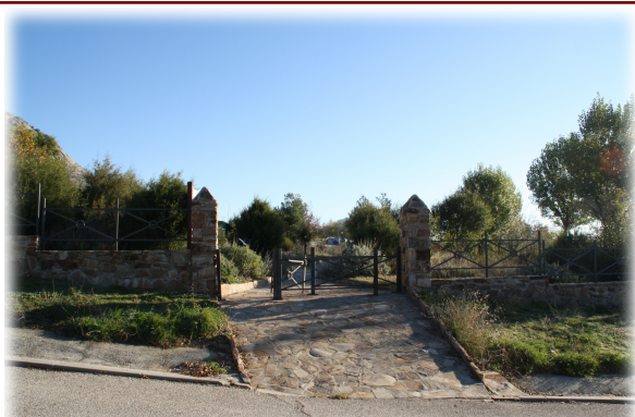
1 y 2. Vistas generales del Arboreto.