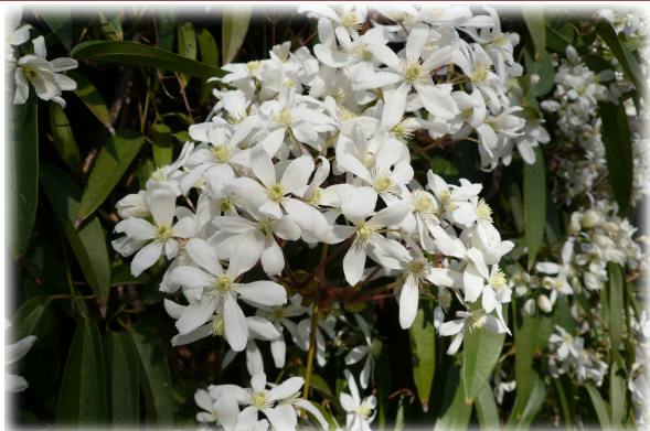
1 y 2. Imágenes generales del Jardín. 3. Floración de Clematide China ( Clematis armandii ).