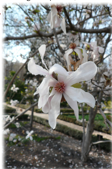
4. Flor de Magnolio Híbrido ( Magnolia x loebneri ).