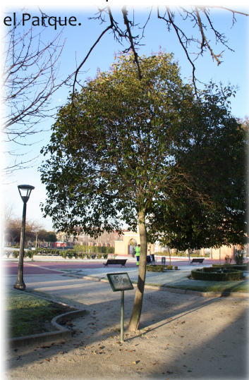
4. Individuo de Aligustre ( Ligustrum japonicum ) en el Parque.