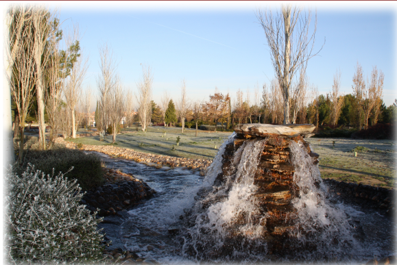
1 y 2. Vistas generales del Parque.