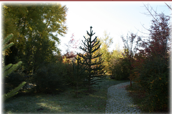
1 y 2. Imágenes generales del Arboreto. 3. Zona del Arboreto dedicada a los bosques de Sudamérica.