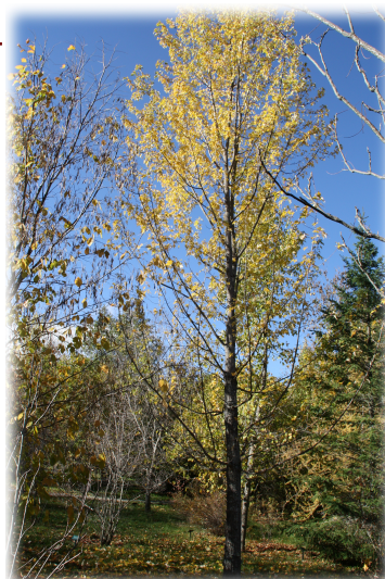
4. Ejemplar de Arce Plateado ( Acer saccharinum ).