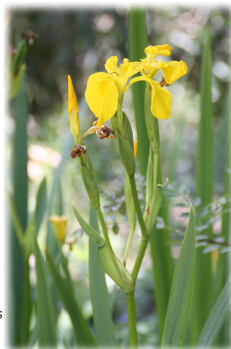
1 y 2. Parterres con vegetación y códigos QR. 3. Parterre dedicado a la flora regional.