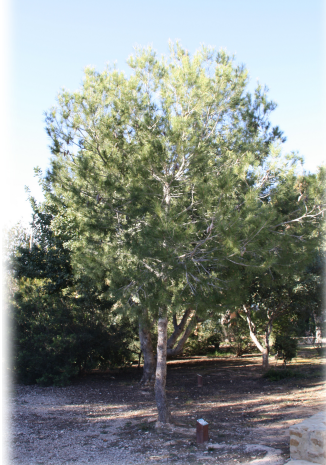
4. Ejemplar de Pino Carrasco ( Pinus halepensis ).