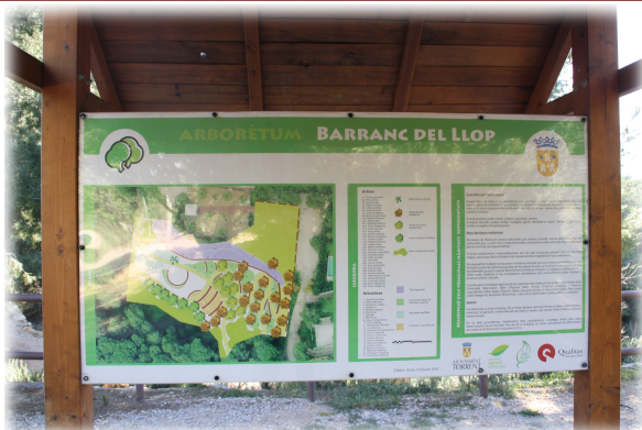
1 y 2. Imágenes de diferentes áreas del Jardín. 3. Cartel situado a la entrada del Arboretum.