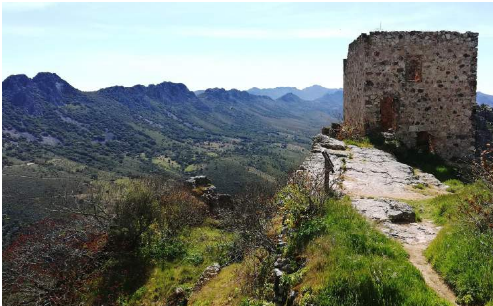
Cabañas del Castillo

En nuestro próximo viaje recorreremos lo mejor de la naturaleza de Extremadura, en su mejor momento, la primavera , cuando el influjo del Atlántico ha dejado notar la generosa humedad que llena vegetación el campo, al tiempo que el clima mediterráneo va derramando la luz y el calor que atiborra de flores sierras y dehesas.