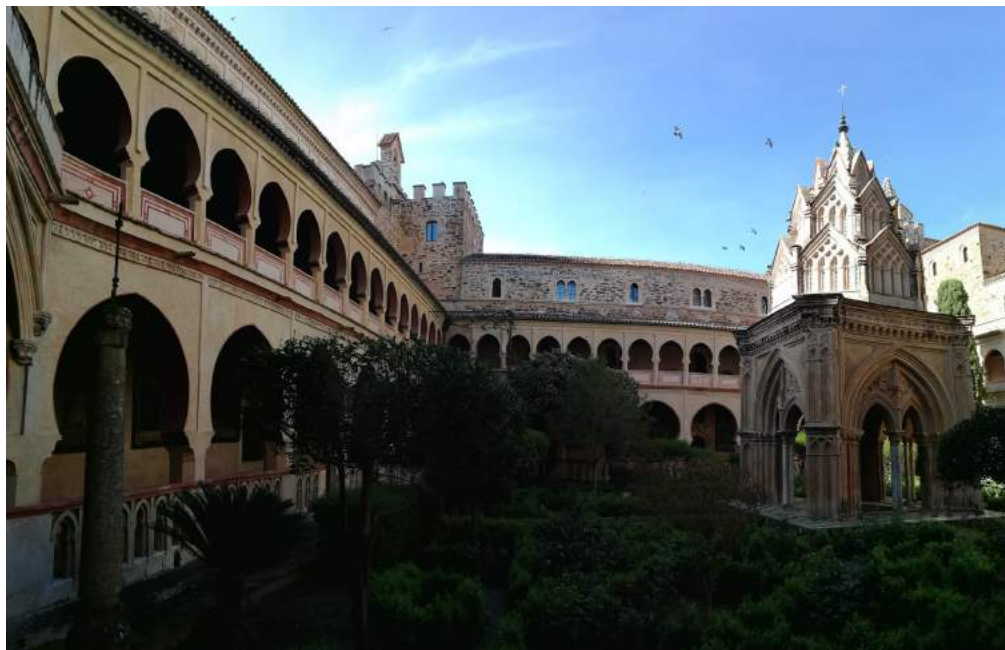
Claustro del Monasterio de Guadalupe