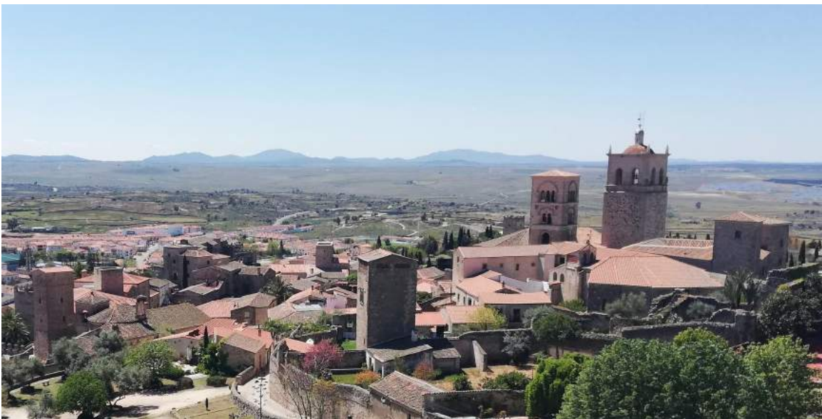
Panorámica de Trujillo