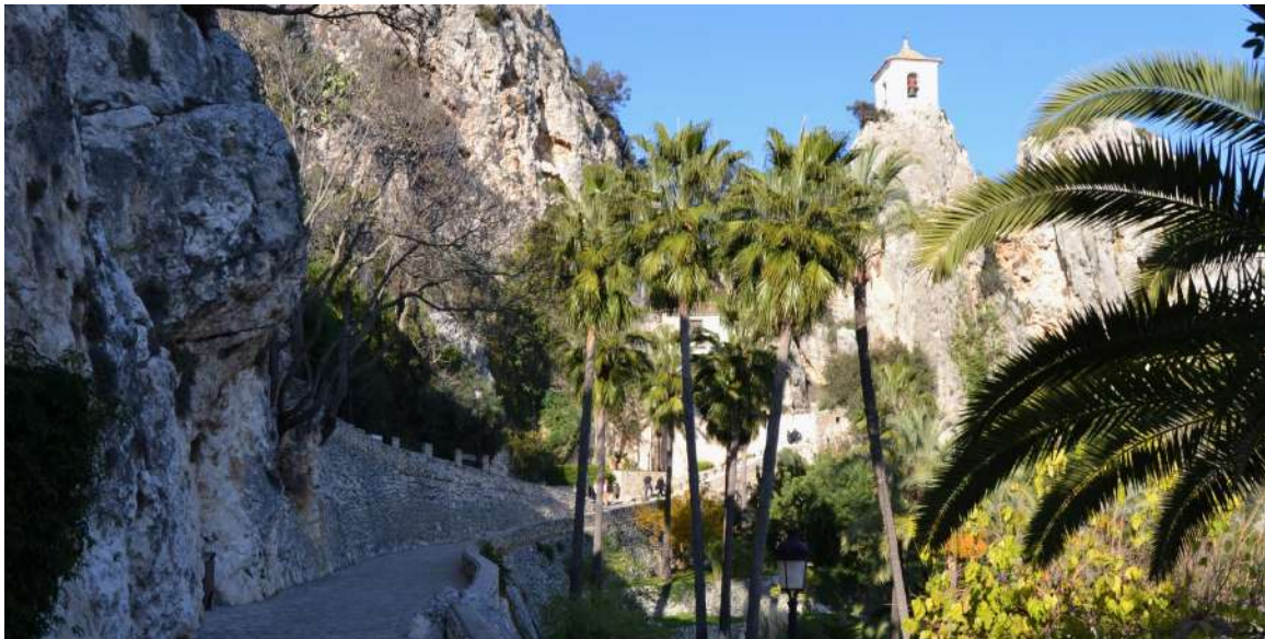
Calles de Guadalest