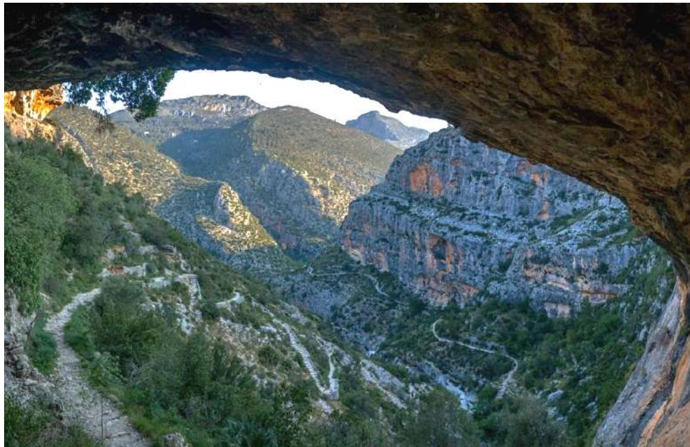
El Barranco del Infierno

El precio de este seguro, para este viaje, es de 10€ , e incluye la cancelación por contagio y cuarentena sobrevenida por COVID 19 .