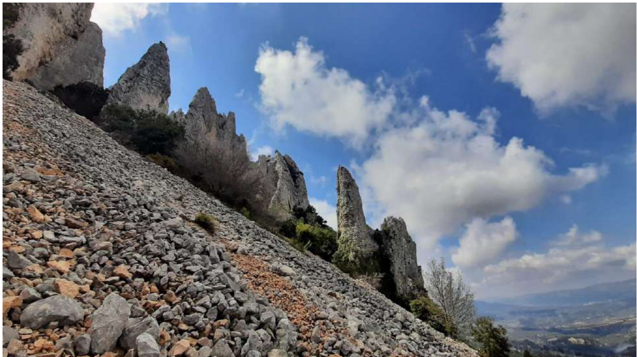
Los Frailes, “Els Frares” de Cuatretondeta

Además, conoceremos las Fuentes del Algar , un conjunto sorprendente de manantiales, pozas y cascadas a un paso del ajetreo de Benidorm, y pasaremos por dos de los pueblos más pintorescos, Altea y Guadalest .