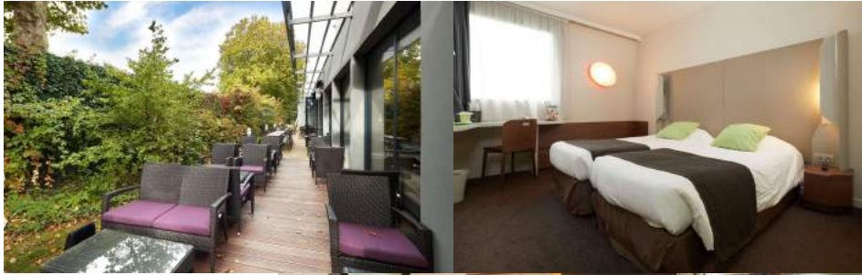
Hotel Campanile Nantes Centre ***

Habitaciones dobles, de matrimonio o individuales, con baño propio. Se ofrece la posibilidad de habitaciones múltiples. Consulta los descuentos