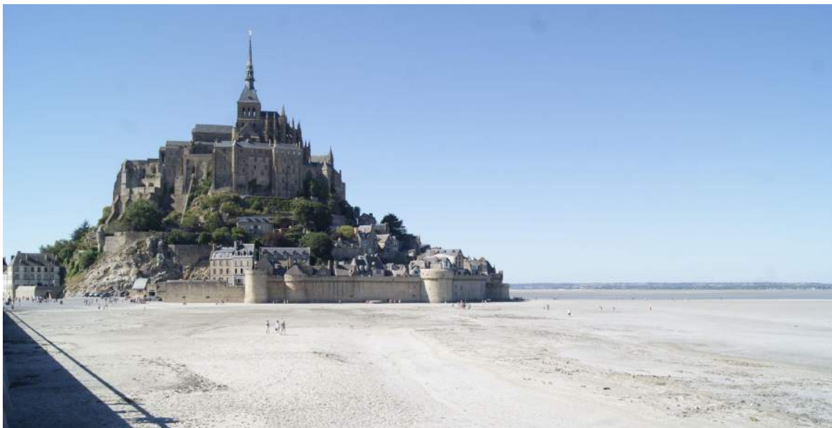
El Mont Saint-Michel

También visitaremos ciudades encantadoras, como Nantes, Vannes, Saint Malo o Dinan y, como guinda del pastel, la travesía de las arenas del Mont Saint-Michel, una caminata única en Europa que rememora la que verdaderamente seguían los peregrinos que se acercaban a la Abadía, cuando no había puente con el continente.