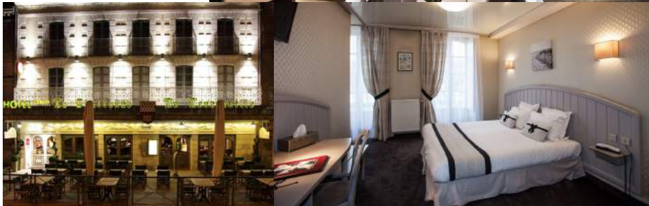
Hotel Le Challenge Dinan ***