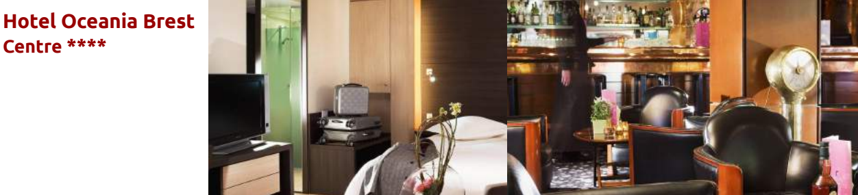
Hotel Oceania Brest Centre ****