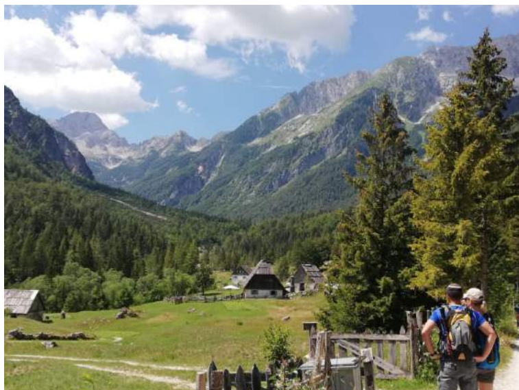
Hotel Alp***, Bovec

Habitaciones dobles, de matrimonio o individuales, con baño propio. Se ofrece la posibilidad de habitaciones triples o cuádruples. Consulta los descuentos