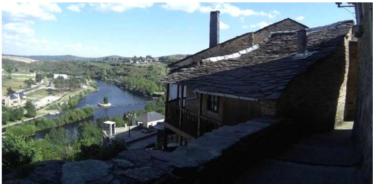
Puebla de Sanabria

Todo ello, alojándonos en el interior del Conjunto Histórico-Artístico de Puebla de Sanabria , donde a buen seguro que la esencia de esta tierra nos entrará por la vista y por la vía de los guisos sanabreses y el buen vino de Toro.