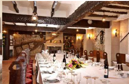
Hotel Bradomín **