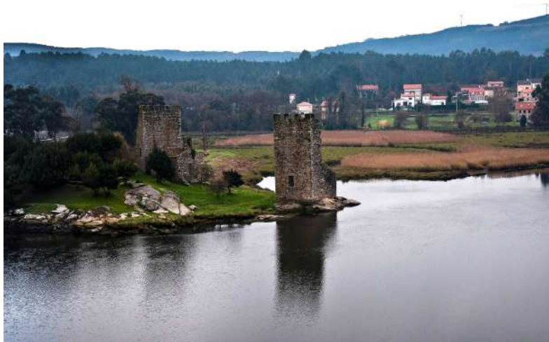
Las Torres do Oeste, guardianas de la Ría de Arousa

Y como la naturaleza irradia la cultura, no dejaremos pasar la oportunidad de conocer al paso el encantador casco antiguo de Pontevedra, monasterios medievales, pazos señoriales , construcciones prehistóricas o preciosos jardines botánicos aquí y allá, que son seña de identidad en esta tierra.