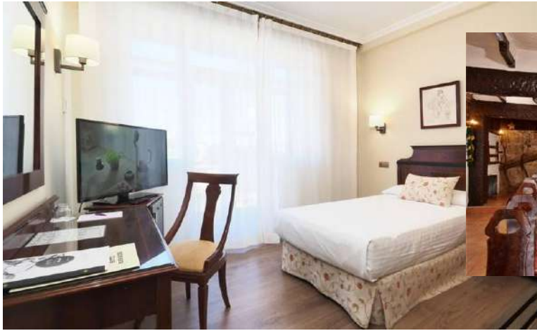
Hotel Rías Baixas ***

Habitaciones dobles, de matrimonio o individuales, con baño propio. Se ofrece la posibilidad de habitaciones triples o cuádruples. Consulta los descuentos