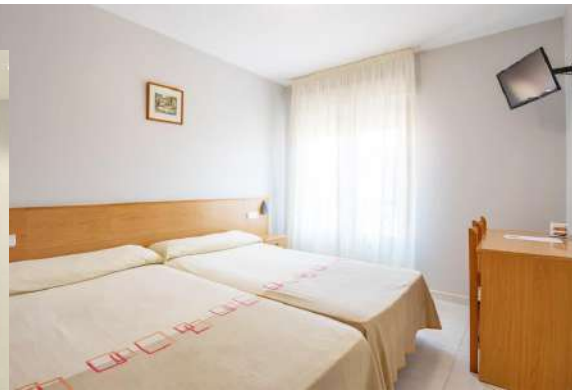
Hotel Rosalía **