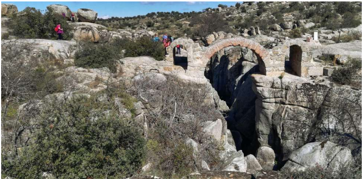
Puente de la Canasta sobre el Arroyo del Torcón

Todo ello, empezando en la propia ciudad de Toledo, de la que conoceremos una cara, la pegada a su río Tajo y la naturaleza que la rodea, que siempre solemos pasar por alto cuando la visitamos, cegados por el esplendor de su monumentalidad.