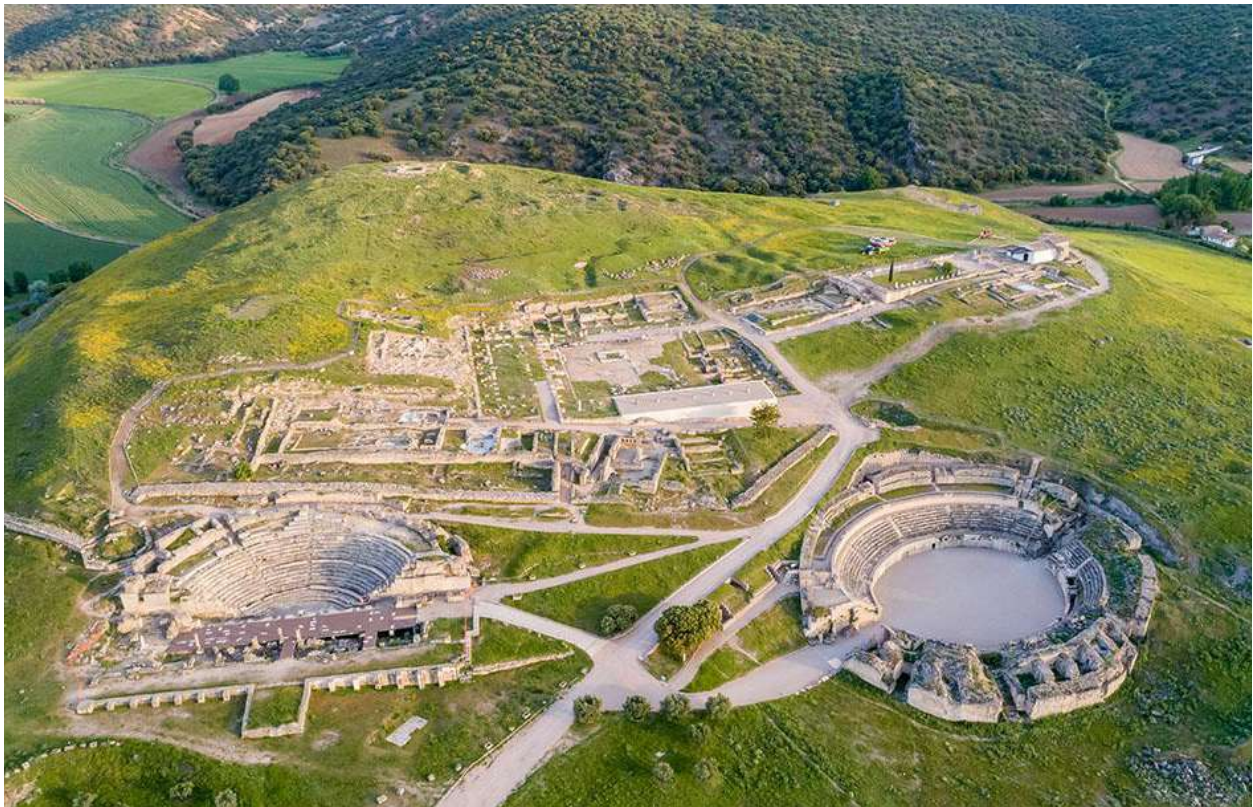
Vista aérea de la ciudad romana de Segóbriga

Pero si esta inmersión por la vía de la naturaleza no fuera suficiente, remataremos estos días en vuestra compañía visitando la Judería de Toledo y el parque temático de la Historia, 'Puy du Fou', un complemento perfecto a nuestras andanzas por los senderos del pasado, donde se recrea el día a día del medioevo toledano. Quizás nos encontremos de nuevo con que el sentir humano tampoco ha cambiado tanto y siempre regresa a las mismas esencias, como las grullas que veremos aterrizar, igual que cada año desde tiempo inmemorial, en la Laguna del Hito.