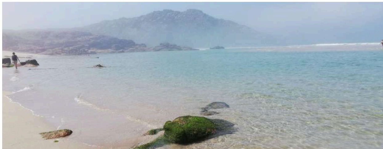
Playa de Trece

CONSULTA “QUÉ PUEDES ESPERAR DE NUESTROS VIAJES” → Última página