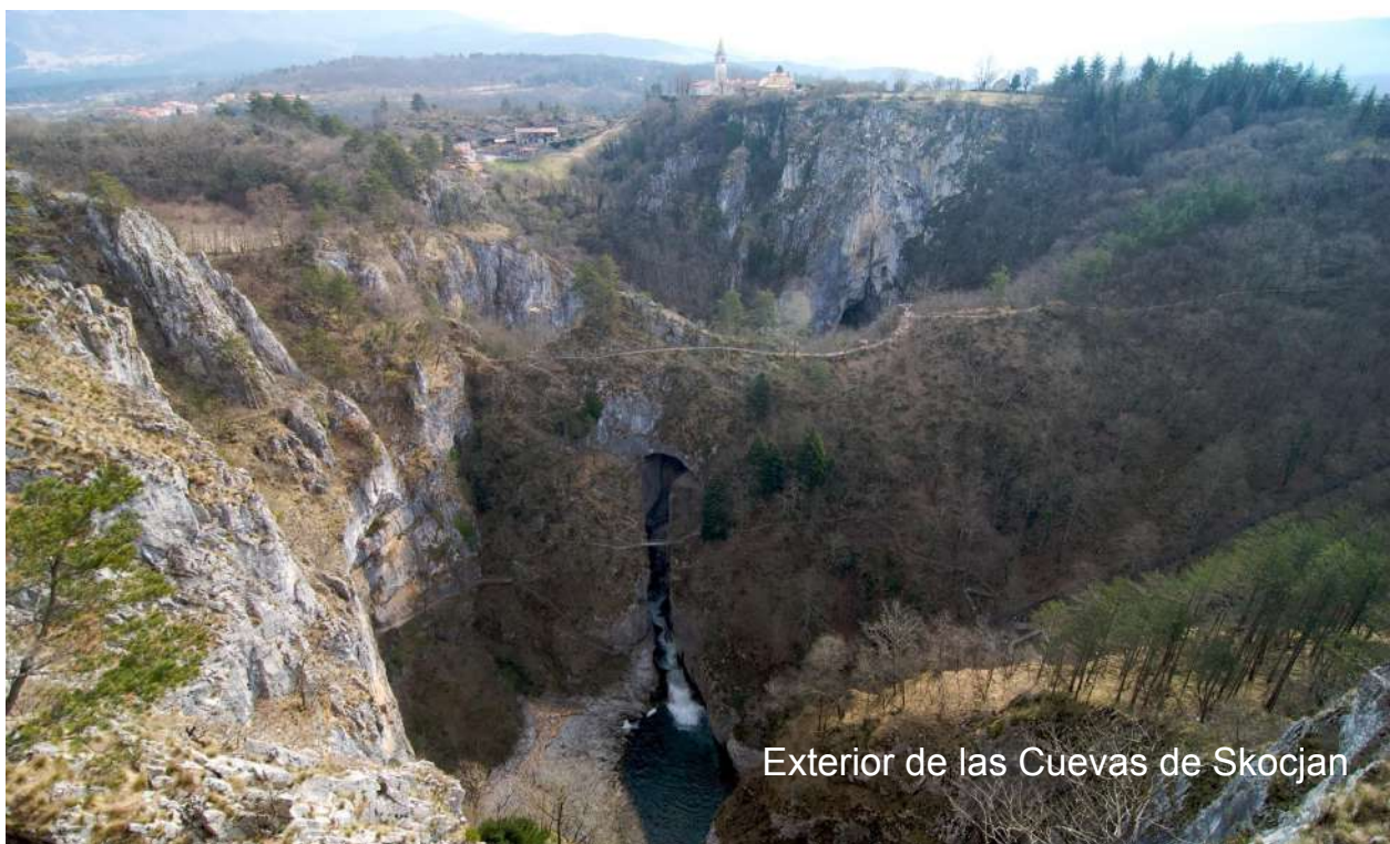
Exterior de las Cuevas de Skocjan

Y, seguramente, al regreso os invadirá la melancolía de Sissi, muy cerca de su castillo de Miramare, por el que habremos paseado en el primer día de nuestra experiencia en Trieste.