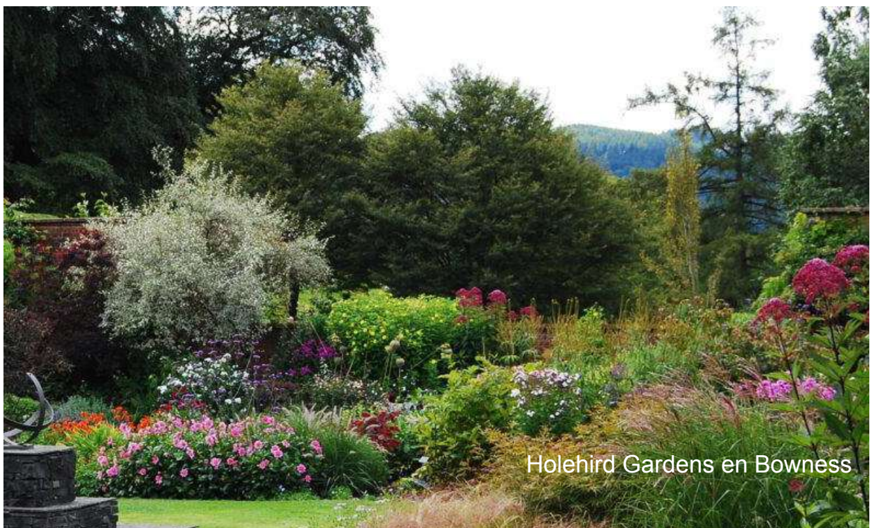
Holehird Gardens en Bowness

Para apreciar mejor el contraste, nuestro primer día aprovechará el tránsito por Liverpool para pasear por una de las cunas de la civilización moderna... y no nos referimos a las fábricas... Let it be.