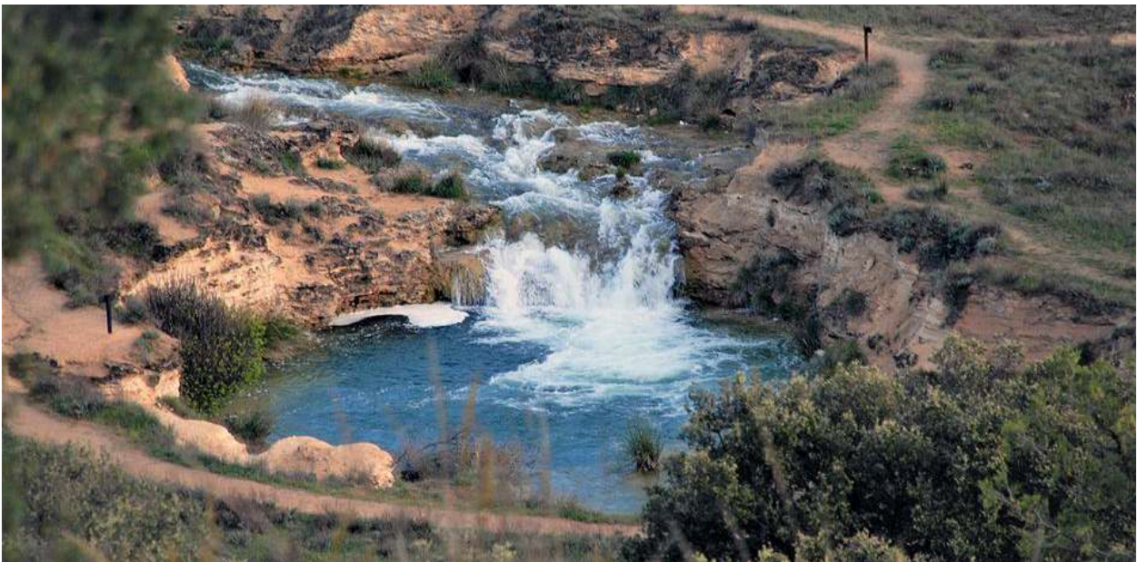
La "Plaza de Toros" del Guadiana Viejo

Os invitamos a venir a este fin de semana de colores que sorprenden, que se multiplican por sus reflejos en el agua , repintados con los increíbles púrpuras de los atardeceres mesetarios. Navegaremos (en bicicleta) por esos mares de álamos y recorreremos veredas que inspiraron a los habitantes prehistóricos de estos oasis en la estepa. Conoceremos una de las plazas mayores más bellas del Renacimiento español y, seguramente, tendremos tiempo de hablar de las andanzas del hidalgo más famoso, cuyo delirio no es tanto, sabiendo cómo puede fantasear La Mancha con sus paisajes.