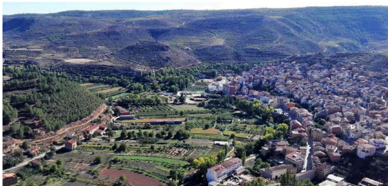
Vista panorámica de Ademuz